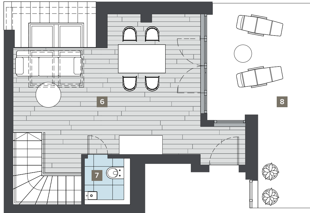
Top floor Dachgeschoss

Total living space (approx.) 77.97 m 2 Gesamtwohnfläche (ca.)