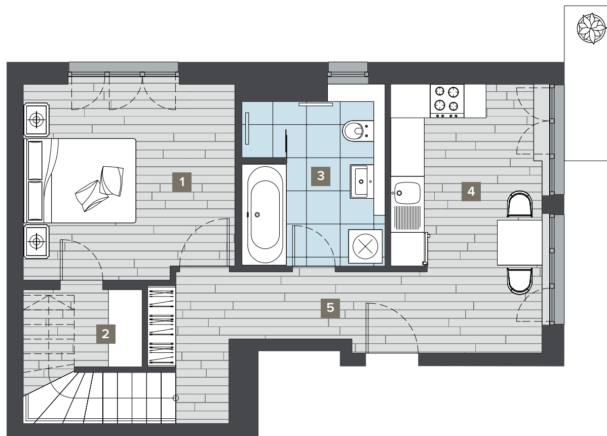
Fourth floor 4. Obergeschoss